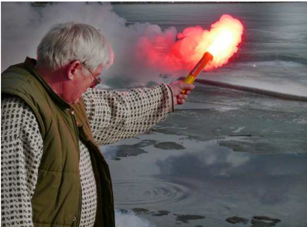
Jukan soihtu palaa.

Kaikkien hätämerkinantovälineiden päiväyksen tulee olla vuodelta 2009 tai tätä uudempia. Vanhempia raketteja, soihtuja ja savuja ei harjoituksessa saa käyttää. Välineet tarkistetaan ennen ammuntoja.